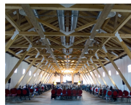
Gut Kaltenbrunn, Gmund